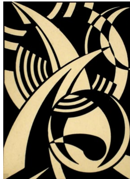
Ontwerp respectievelijk boekomslag Jef Denyn en Staf Nees, Beiaardspel Mechelen - Recitals de Carillon Malines, 1939