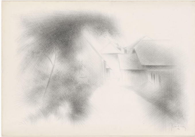
Belvaux II (Ardennes) (Collectie KMSKA)