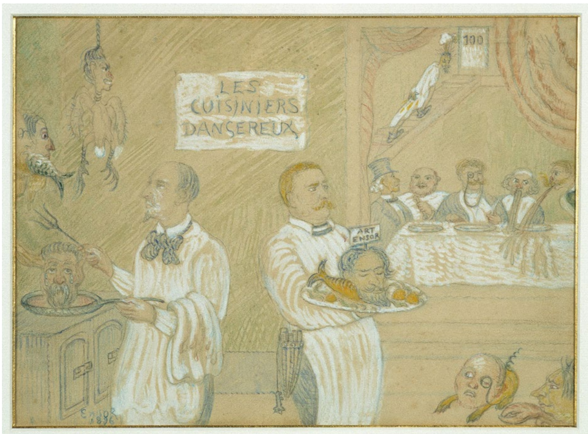
James Ensor, Les Cuisiniers dangereux , pasteltekening, 1896, (afm. 248x342 mm / 405x486 mm incl. lijst)

De hoofden van andere leden van 'La Libre Esthétique' liggen klaar als ingrediënten voor de gevaarlijke koks: