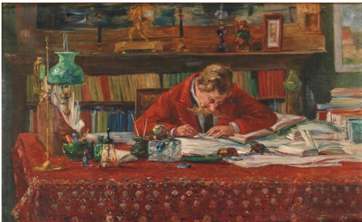
Emile Verhaeren aan zijn werktafel

*) In 1987 verscheen bij het Museum Plantin-Moretus te Antwerpen de uitgebreide catalogus (661 p.): Le salon Émile Verhaeren: donation du président René Vandevoy au Musée Plantin-Moretus à Anvers = Het salon Emile Verhaeren: schenking voorzitter René Vandevoy aan het Museum Plantin-Moretus te Antwerpen , René Vandevoy / Francine de Nave.