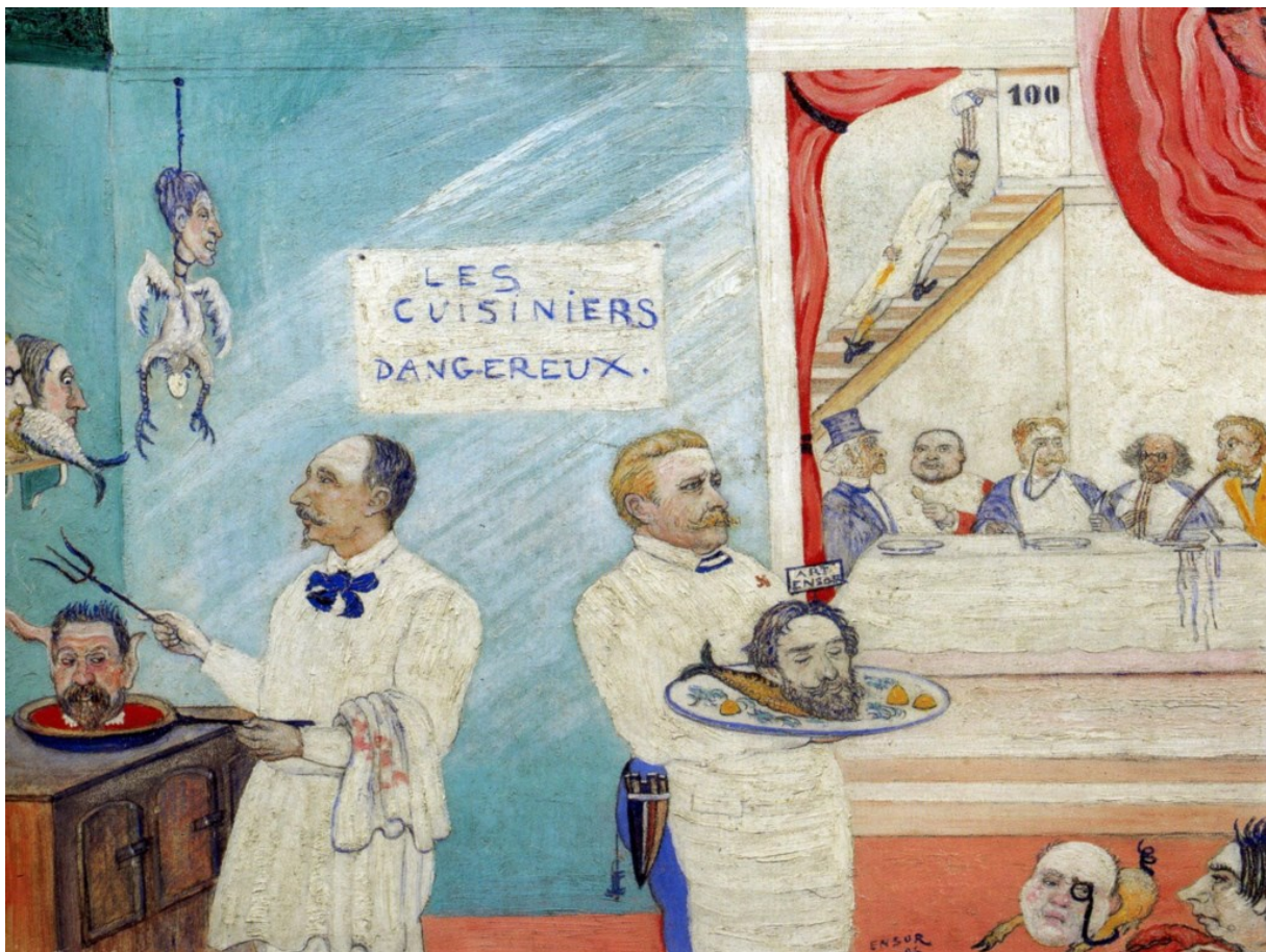
James Ensor, ‘Les cuisiniers dangereux’, 1896, olieverf op hout, 38 × 46 cm