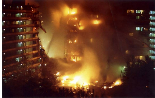
Bijlmerramp: zondagavond even over half zeven boort een El Al vrachtvliegtuig zich in twee aan elkaar gemonteerde flatgebouwen 'Kruitberg' en 'Groeneveen'.

meeste romantische filmscenario's. Dat beseften we ten volle toen we op de terugweg naar België, ergens tussen Amiens en Rijsel, de autoradio aanzetten en vernamen dat er in Amsterdam een jumbo was neergestort op een dicht bewoond flatgebouw. Vele tientallen, God weet misschien honderden toekomstverwachtingen waren met één klap, van het ene ogenblik op het andere, in de vlammen opgegaan. Je zit zondagavond knus voor de televisie en zonder enige waarschuwing vliegt de dood met een donderend geraas je kamer binnen. We zijn er alle twee stil bij geworden. Het wierp een schaduw over onze laatste vakantiedag.