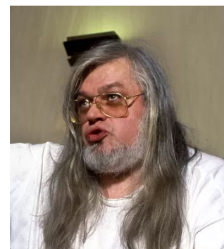
Jean-Pierre Van Rossem in 1992